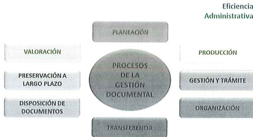
Grafica 2: Proceso de Gestión Documental